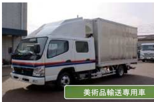
美術品輸送専用車