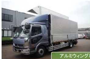
アルミウィング車